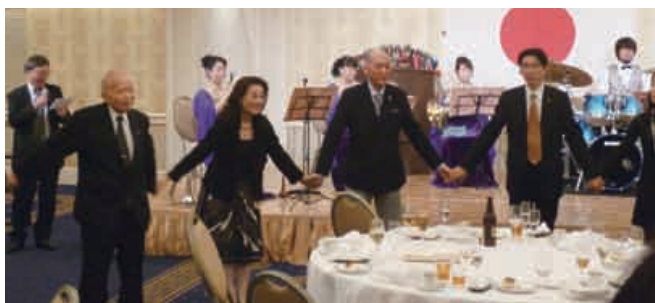
また会う日までを歌う出席者

いよいよ、お開きとなり、「また会う日まで」を全員で手に手を取り合って、一年の締めくくりとして歌いあげました。