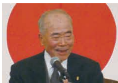
クリスマス委員長 L尾崎

今年のショータイムは日本初の女性金管5重奏団レディース ブラスの皆様で、数々に名曲を聞かせていただきました。