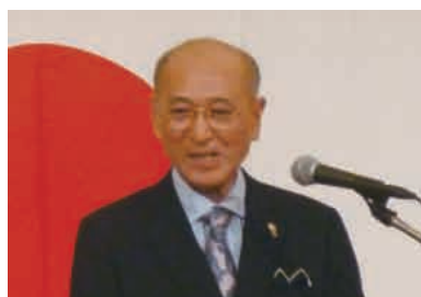
L一柳会長 あいさつ