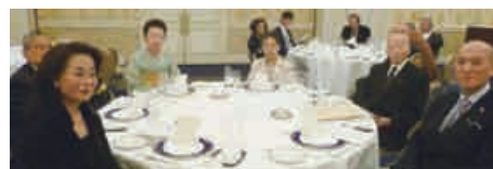
出席会員・ 家族の皆様 のテーブル写真

今年のショータイムは日本初の女性金管5重奏団レディース ブラスの皆様で、数々に名曲を聞かせていただきました。