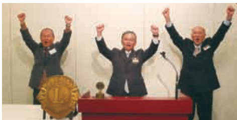
3クラブ会長によるライオンズ・ローア