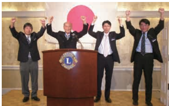
三役とL三國(計画)による最終ローア