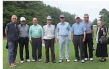
スタート直前メンバー