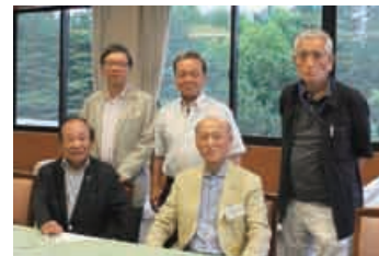
パーティー会場のメンバー