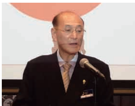
L一柳会長 あいさつ

5月3日は暦では立夏と言います。少しずつ暑くなってきました。私は冬より夏の方が好きですが、暑い季節ですので皆様には、体調に十分お気をつけてください。