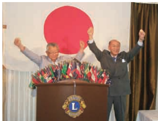
一柳会長、L田中による力強いローア