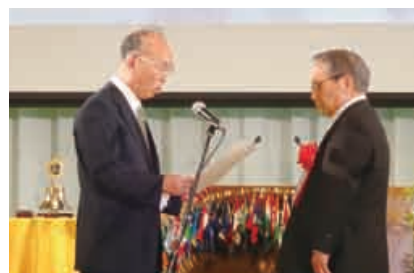
スポンサー クラブへ 感謝状贈呈

第1232回例会は334複合地区第61回年次大会(5月24日・名古屋国際会議場)をもって開催されました。