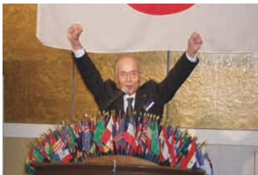
お誕生日のL尾崎会長によるローア