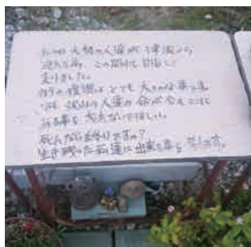
閑水地区で亡くなった 子供達を悼む

翌日のエクスカージョンでは世界遺産平泉金色堂を見学し、被災地視察として宮城県名取市閑水地区を訪れました。